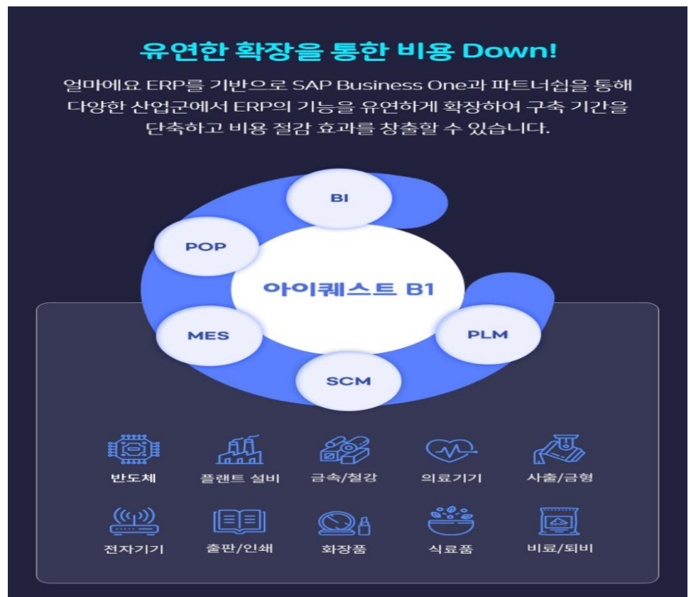
그림 2. 다양한 분야에 사용될 수 있는 아이퀘스트 B1